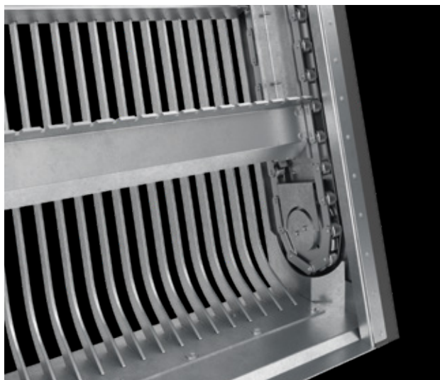
Böjda stavar i botten för högre kapacitet, lågt blindsteg och optimal materialupptransport.

Används för: grovavskiljning före pumpstationer, vattenintag, reningsverk, skyddsgaller före känslig finavskiljning. Kedjedrift med flera krattor ger täta rensningscykler vilket ger hög flödes och transportkapacitet.